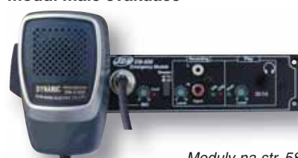
Moduly na str. 58