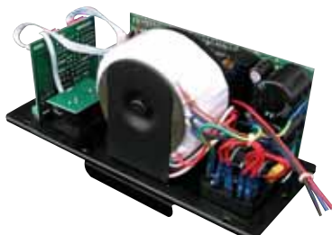
ZS 301 celopásmový, 2 kanály, 300 + 100 W