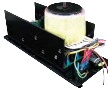
ZS 351 subwooferový, 1 kanál, 400 W