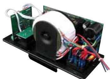
ZS 291 celopásmový, 2 kanály, 100 + 50 W